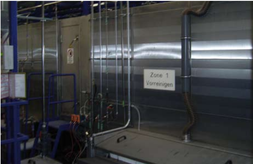
Eine gute Vorbehandlung ist die halbe Reinigung: hier eine von vier Durchlaufstationen.

wird ein Großteil der Feuchte, die in der Abluft steckt, über ein Abscheidesystem wieder zurückgewonnen. So werden circa 200 Liter Wasser pro Stunde eingespart.